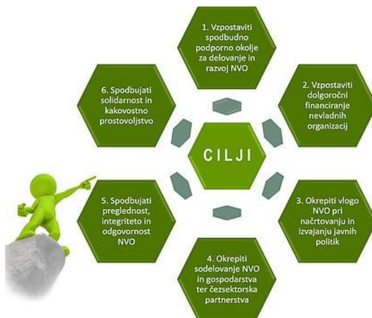
Slika št. 1: Glavni cilji Strategije razvoja NVO in prostovoljstva